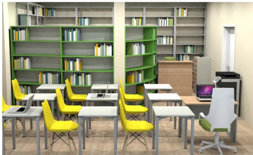
Создание ИБК – центра